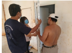
オームルー保健センター