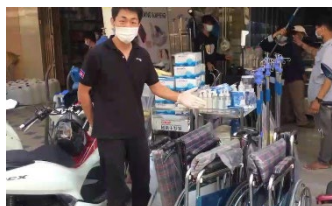
プノンペンで購入