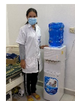
外来・入院患者、医療者用の飲料水機材