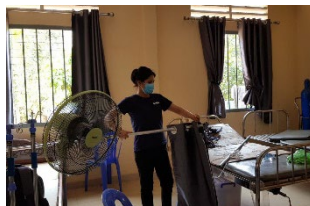
アレアッタノー保健センター