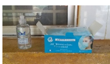
コロナ感染対策のための消毒用アルコールジェルとマスク