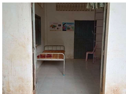
ピラムゴスナー保健センター産後ケア室