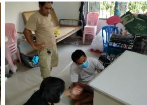
ピアムゴスナー保健センター