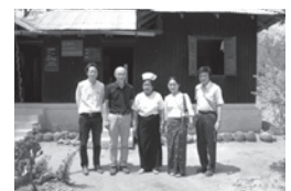
地域保健センター訪問

ネピドーのタツコン郡のタツコン病院、地域保健センターを訪問、サブセンター建設候補地を視察した折には、その