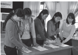
サンプルを使って自己触診法を習得

2013年1月~12月の初年度は事業目標(対象地域5省、対象女性3,500名)を上回る3,794名に対し研修を実施しました。