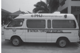
タッコン郡病院が使用する救急車

PHJ ミャンマー事務所では、2015年3月の事務所開設から、活動対象地区であるタッコン郡の母子保健環境の向上を目指して、活動を行ってきました。事務所開設以降、活動目標の一つである搬送システムの強化を目標として、寄贈用救急車の輸送手配を行いました。この救急車は、上益城消防組合様(熊本県)がアステラス製薬株式会社様から寄贈を受けて使用してきたものをPHJが譲り受け、ミャンマーへ寄贈した経緯があります。