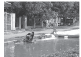
炊事、洗濯、排せつに使われている川

村をちょっと歩いてみるだけで、決して綺麗ではない川で水浴び、炊事、洗濯、用足し場面や、散乱したゴミをたくさん目にします。PHJとして「衛生環境改善」事業を開始いたします。教育と意識改革から地道な草の根活動を始動します。