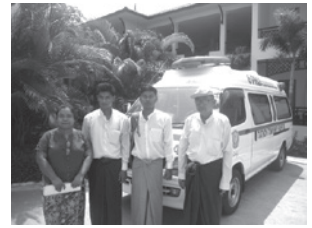
保健局のスタッフとPHJスタッフ (右から二人目)

救急車の通関が完了した後は、車体への保健省のロゴと文字入れ、車体のメンテナンス、酸素ボンベの手配等を終