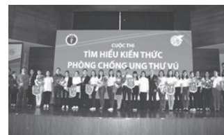
「乳がんの知識を広めよう」というコンテスト

また、2年目の最後となる12月には、本事業をさらに省レベルでのWUの活動に統合させることを目的に、保健省と合同で「乳がんの知識を広めよう」というコンテストを行いました。5省の対象地区に加え、ハノイ市、ホア・ビン省、ハイ・デュオン省から代表者40名が参加しました。