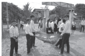
清掃活動をする小学生たち

コンボンチャム州の保健局、州病院を訪問し、PHJの支援活動に対する深い感謝と今後も全面的にサポートするとの力強いコメントをいただきました。州病院は立派な建物や設備があり人材も豊富、また廊下まで患者が溢れているほど活況でした。一方、事務所から車で悪路を1～2時間の3つの支援している保健センターは水道、電気がなく、建物、設備、器材も古く、病院との大きなギャップがあります。メンテナンス等のフォローを行って、一次医療をキッチンと機能継続させることが