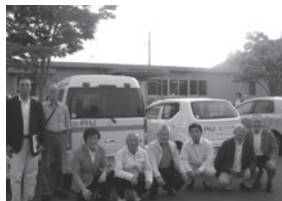
寄贈したドクターカー (左) と軽自動車

震災から 4 年、今大きな問題になっているのは仮設住宅や被災した自宅で一人住まいの高齢者にストレス