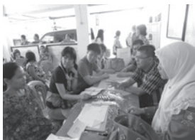
MCHクラスで妊婦さんをインタビューしている様子

村の集会場で行われていたMCHクラスは、助産師の方々が家族計画についてワークショップを行っていました。集まった妊婦さんやお母さん方が積極的に参加しており、その活発さに驚いたのを覚えています。ワークショップの後には検診も行われており、MCHクラスの果たす役割の大きさを実感した場でした。検診待ちの間には妊婦さんの