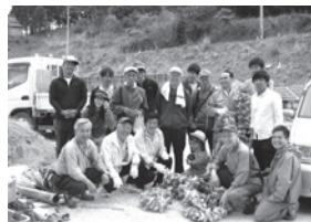
ボランティア仲間たち

が原因と思われる認知症、うつ、アル中等が増えているとのことです。ブルドーザーが行きかう復興建設現場では最近材料不足や作業員確保の難しさから工事の遅れが目立ち始め、公営住宅の完成や引っ越しの時期も見えない地域があり、狭い仮設住宅でお住まいの方々のご苦労はいかばかりかと現地を訪れるたびに胸が痛みます。PHJ は総合的健康づくりに取り組んでいる石巻市立病院包括ケアセンターで必要とするリハビリ器具類がこれからの支援になるかと思っています。石巻支援は篤志家様から 5 年間の義援金をお預かりしており、これからもドナー様へ年 2 回の活動報告をしながら支援を続けて行きます。