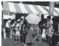
第24回三鷹国際交流フェスティバル

場所 井の頭恩賜公園 西園 東南アジアブロック 沢山の方に訪ねて頂き ありがとうございます。