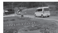
石巻に寄贈した移動診療車は訪問診療に使われています

4. 東日本大震災支援活動 (総事業費 5,285万円): 全日本病院協会と連携した復興支援活動は気仙沼市医師会の協力で民間医療機関へ不足している医療機器、用品、備品を寄贈しました。また訪問医療が出来なくなったクリニックへの移動診療車の寄贈とともに、医師会へも車の寄贈を行いました。石巻と多賀城が新しい支援先として加わり、石巻では仮設住宅1,900棟、約4,000人が入居している地域の仮診療所ヘドクターカーを寄贈し、多賀城では透析用医療機器を提供しました。このほか多くの企業から医療用マスク、消毒スプレーなどの支援物資を被災地へ届けました。