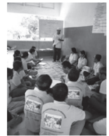
村での保健ボランティア会議

特筆すべきは、保健搬送システムの導入です。搬送システムは、大塚製薬様より当地で広く利用されている交通手段Tuktukをご寄贈頂き、緊急時（お産や病状の悪化等）に村と保健施設を結ぶ足を確保するものです。本年度までに計6台のTuktukを寄贈頂き、保健センター2か所、村8か所で稼働させました。今期計81件搬送実績があり、多くの緊急ケースが手遅れとなる前に救われました。このシステムの運営は、村で運営委員会を組織し、搬送時の対応、問題解決、資金の管理を担っています。運営委員会には④村と保健センターのネットワーク支援や⑤村での保健教育の活動でPHJと協働している保健ボランティアが参画、運営の中心を担っており、他活動での地域保健人材育成の成果が表れています。