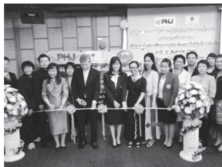
キックオフミーティング