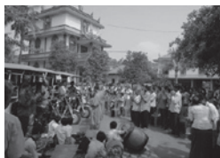
チュクサク地区でのTukTuk 寄贈式

CCMNの育成では、今期対象としている4地区で54名を新規育成しました。前年度の育成を合わせると合計84名のCCMNを誕生させました。現在では、コンポントム州保健局からの依頼で2010年度にUnicef育成のCCMNも支援対象に含め、総勢111名の活動フォローアップ（戸別訪問活動に随伴し技術指導を行う）を実施しています。CCMNは自分たちの村で産前・産後の女性を戸別訪問し、母子保健教育や相談を提供しています。村の女性がお産時に彼女らを頼って連絡し、保健センターに随伴してもらうケースも多くなり、CCMNの村での存在感が増しています。