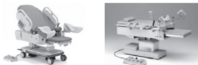
気仙沼産婦人科クリニックへ分娩台・手術台を寄付