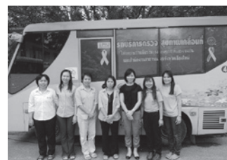
検診推進キャンペーンの PHJメンバーとミニバス

今回のキャンペーンでも、61歳で初めて検診を受けるという女性や検診に対して抵抗があったという独身女性が参加していたりと、ヘルスポランテアの日頃の活動の成果が表れていました。