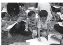
障がい児のリハビリ教育で絵を描いているところ

3. タイ支援 (総事業費 3,150万円): 5大学の学生を対象にしたHIV/エイズ予防教育支援はチェンマイ保健局と提携して行い、過去10年に亘る成果の評価は外務省の補助金を取得して実施しました。外務省からの補助金事業である子宮頸がん・乳がん検診推進支援は2012年10月に第2年度を終え、同年11月より第3年度の活動を実施しています。HOPEパートナー教育支援はタイの医療保険制度