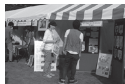
2012年のグローバルフェスタ