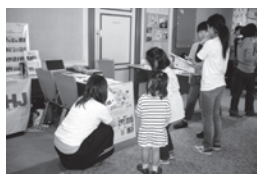
2012年のむさしの国際交流まつり

出展内容 「アジアのおはなしカレンダー 2014」のために描いた絵の展示 アジアの母と子を支える事業活動の紹介 2014年のスタディツアーのワークショップ