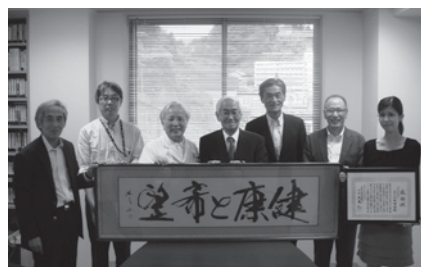
気仙沼医師会長から PHJ へ感謝状を頂く