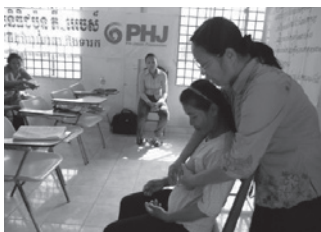
CCMN リフレッシュ・トレーニング

CCMNの育成では、今期対象としている4地区で54名を新規育成しました。前年度の育成を合わせると合計84名のCCMNを誕生させました。現在では、コンポントム州保健局からの依頼で2010年度にUnicef育成のCCMNも支援対象に含め、総勢111名の活動フォローアップ（戸別訪問活動に随伴し技術指導を行う）を実施しています。CCMNは自分たちの村で産前・産後の女性を戸別訪問し、母子保健教育や相談を提供しています。村の女性がお産時に彼女らを頼って連絡し、保健センターに随伴してもらうケースも多くなり、CCMNの村での存在感が増しています。