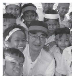
小学校の子供達と

そんな屁理屈はさておいて、カンボジアの状況を知りたい私にとってPHJをはじめとするブログやFacebookは欠かせない楽しみの一つになりました。