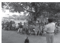
衛生モデル世帯への衛生教育

1. カンボジア支援 (総事業費 1,847万円): 国連ミレニアム開発目標 (MDGs) のうち安全な出産と子どもの健康な発育を目指して活動しました。コンポントム州で実施した母子保健改善のための健康な村作り事業は外務省からの補助金を頂き2年目の活動を終えました。プレイベン州での母子保健助産師トレーニングは当期で終了しました。